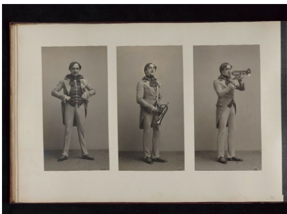
3 Rollenporträts: Hubert Marischka als „Olivier, Cabaretier und Direktor“ in „Didi“, Carltheater, 23.10.1909 (Marischka-Album 2: Die geschiedene Frau, Didi, Zigeunerliebe. 1908 - 1910)