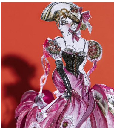
Plakatsujet Theatermuseum