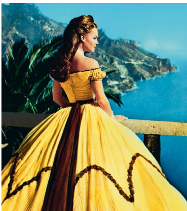
Sissi – Schicksalsjahre einer Kaiserin (Österreich 1957) Regie: Ernst Marischka, 19. Dezember 1957

Anlass der Ausstellung ist die digitale Erfassung von Hubert Marischkas über 20.000 Archivalien umfassendem Nachlass. Dieser wird mit weiteren seiner Bestände online zugänglich gemacht. Ausgewählte zeitgenössische Positionen werden zudem das Schaffen der Marischkas kommentieren und kontextualisieren.