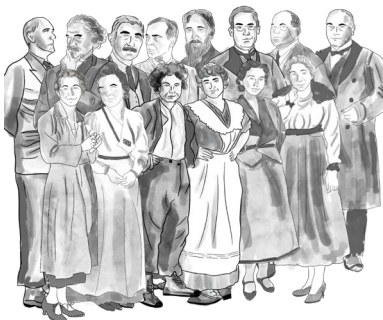
Zeichnungen: © Eva Leitner

Eine Kooperation des Theatermuseums mit Studierenden und dem Archiv des Instituts der Theater-, Film- und Medienwissenschaft an der Universität Wien.